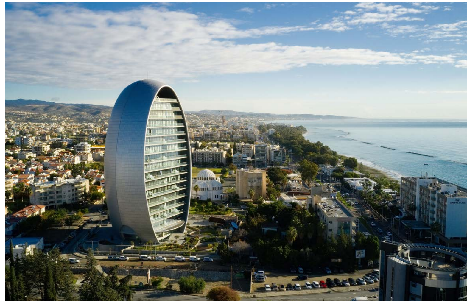
The Oval, Лимасол