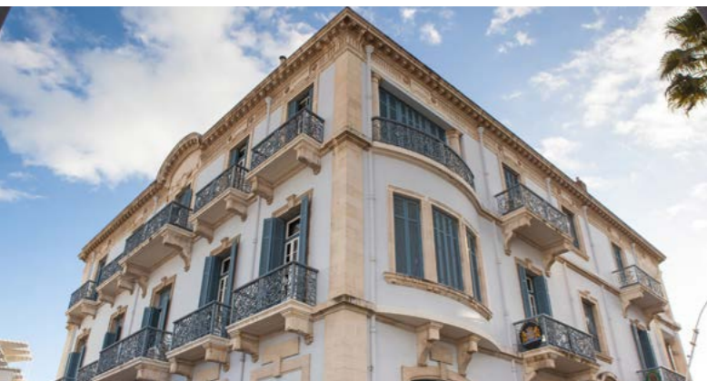
Lanitis E.C. Holdings, Лимасол