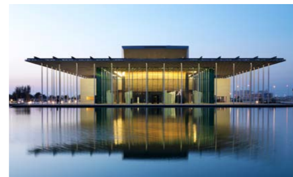
Национальный театр Бахрейна