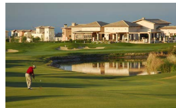
Aphrodite Hills Golf Resort, Пафос