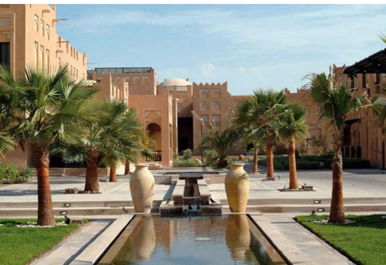
Al Sharq Hotel, Катар