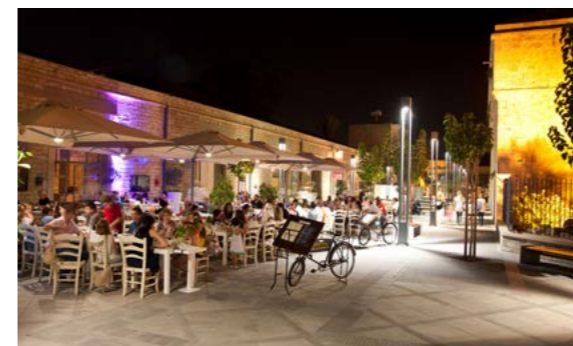
Carob Mill Restaurants, Лимасол