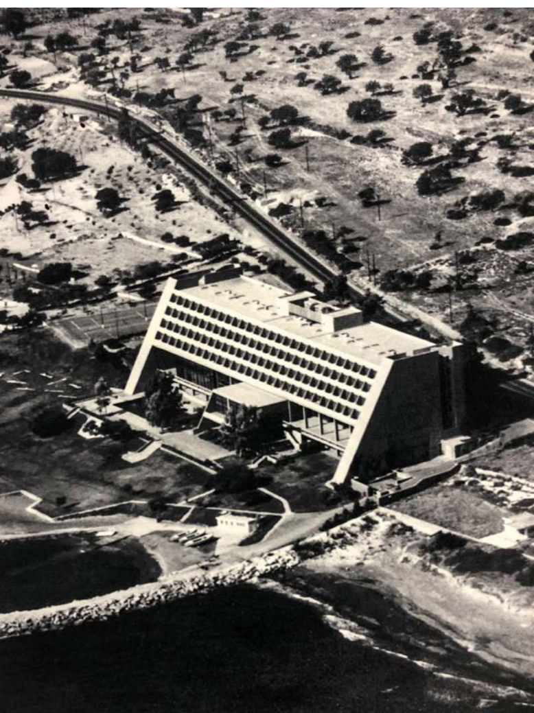
Amathus Beach Hotel, Лимасол