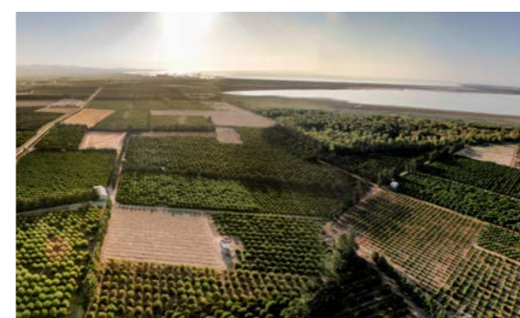
Limassol Greens Golf Resort