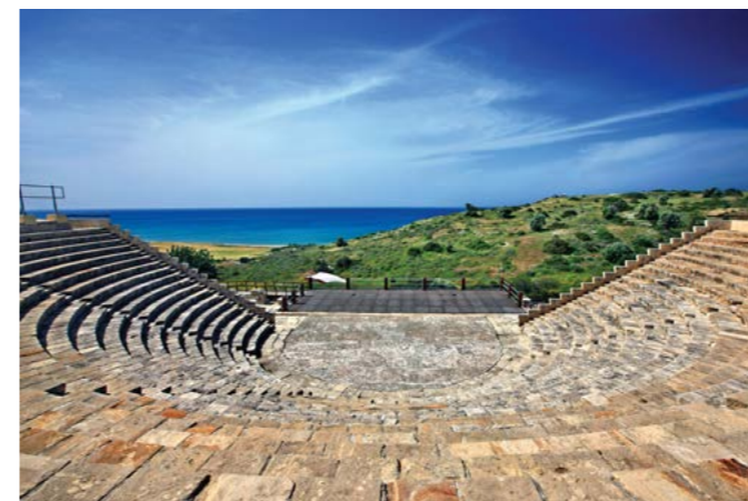
Древний амфитеатр Куриона